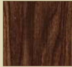
Akazia Paneele: 15511 Kassette: 15611