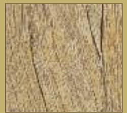
Sibirische Lärche gekalkt