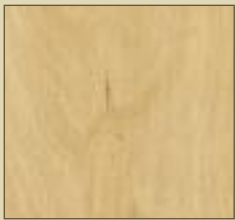
Apfel natur Paneele: 15505 Kassette: 15605