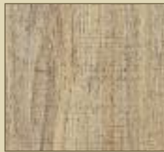
Eiche gekalkt Paneele: 15510 Kassette: 15610