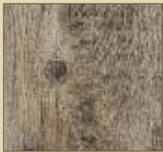
Birke gealtert Paneele: 15509 Kassette: 15609