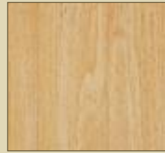
Buche Paneele: 15500 Kassette: 15600