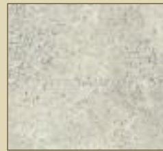
Silverstone Paneele: 15516 Kassette: 15616