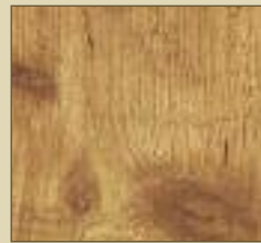
Kiefer rustikal Paneele: 15508 Kassette: 15608