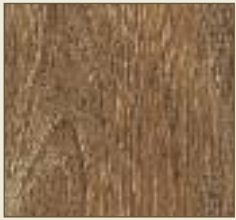
Brauneiche natur Paneele: 15529