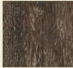
Brauneiche geräuchert Paneele: 15530