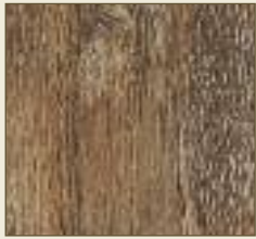
Brauneiche gealtert Paneele: 15528