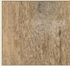
Brauneiche gekalkt Paneele: 15531