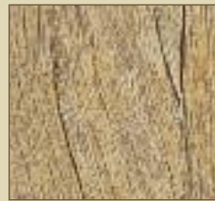
Sibirische Lärche gekalkt Paneele: 15504 Kassette: 15604